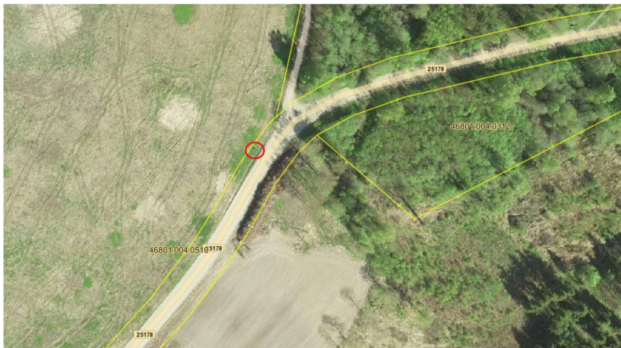
Foto 1. Määsi-Kiviora tee neelukaev